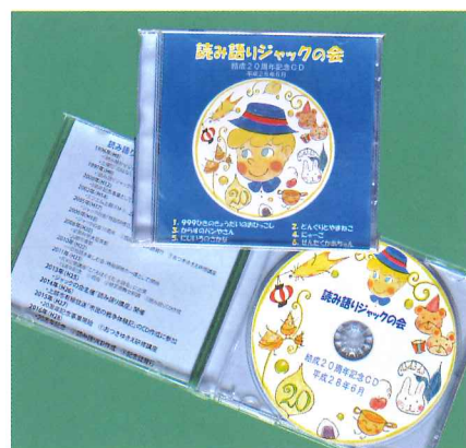
オリジナルキャラクターがジャケットを飾る記念CD

結成20周年の節目を新たな第一歩に、読み語りジャックの会のさらなる発展を期待し、引き続き会員の皆さんの協力・出演を得て「お話玉手箱」ただいま好評放送中です。