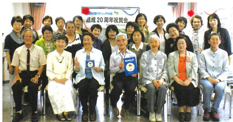
20周年を祝う会にて。みんな笑顔でハイチーズ!

この間、毎月の例会やテーマを決めて取り組む特設研修会、講師に学ぶ研修会やワークショップなどに積極的に参加して研さんを積み、読み語りの講師として各方面から依頼を受けたり、市民を対象に「読み語り講座」を主催するなど活躍の場を広げられました。